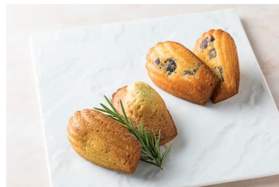
▲「パノラミックキングルーム」イメージ（左） プラン特典「ローズマリーと栗のマドレーヌ」イメージ（右）