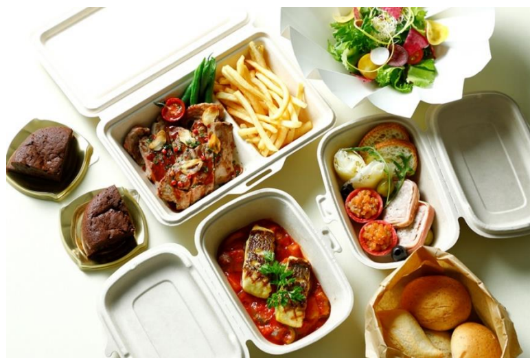
前菜からデザートまで楽しめる ダイニングセット

*とうきょうサラダとは...東京メトロ東西線の高架下で無農薬の水耕栽培によって育てられた安心・安全な野菜。みずみずしいパリっとした食感とえぐみの少ない味わいが特徴です。