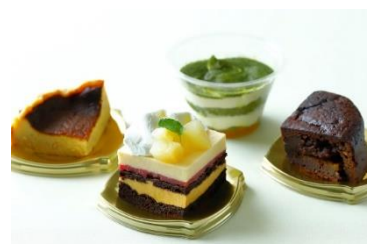
秋のカットケーキ4種