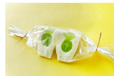
シャインマスカットの ホイップサンドウィッチ

フルーツサンドウィッチのために作られたやわらかなパンと、ジューシーで弾けるような食感のシャインマスカットを包み込んだホイップクリームとの相性が絶妙。 ブドウの女王と呼ばれるにふさわしい芳醇な香りと上品なテイストをお楽しみください。