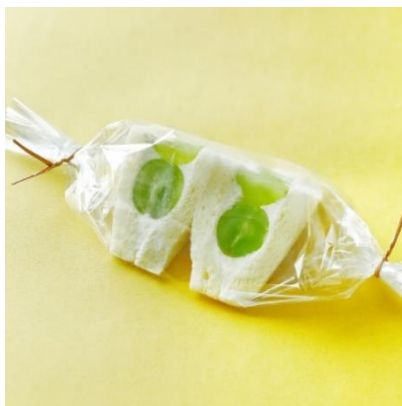
シャインマスカットの ホイップサンドウィッチ