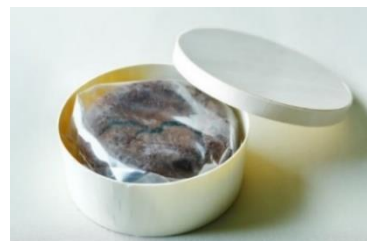
東京都八王子産パッションフルーツが アクセントの贅沢ガトーショコラ

香り高く上品な甘さのフランス産チョコレート2種類をブレンド、そこにアクセントとしてパッションフルーツのソースを閉じ込めることで果実の甘みとさわやかな酸味が変わり、これまでにない味わいになりました。しっとりとした食感のガトーショコラはティータイムや食後のデザートにぴったりです。