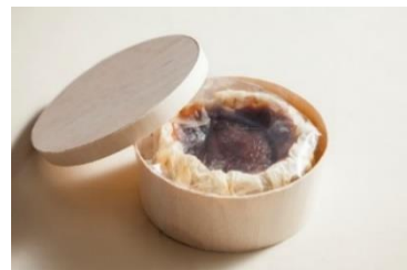
ウェールズ産チーズが香る 濃厚バスクチーズケーキ

滑らかな舌触り、焦げ目のほどよい苦み、隠し味のブラックペッパーがお酒との相性も抜群な味わいです。