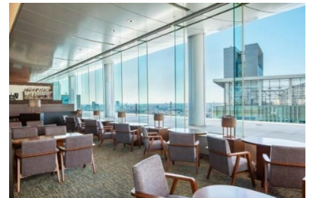
ラウンジ サウスコート