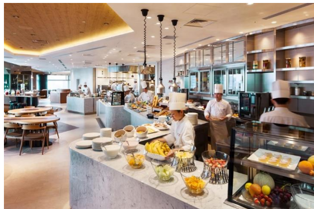
サザンタワーダイニング 朝食buffet

今回のお楽しみは、“元気をチャージ”がメインコンセプトの朝食buffet。通常の料理に加え、数種類の験(ゲン)担ぎ食材をご用意した、ホテルのスタッフが全力で応援する「受験生・新生活応援特別コーナー」を本プラン販売期間中設置いたします。プラン特典には、1泊1名様に必ず1枚付2500円分のホテルクレジットを利用して、ランチやスイーツ、ディナーなどを、20階のサザンタワーダイニングやラウンジ サウスコートで気分転換にお楽しみいただけるほか、通常11時までのチェックアウトが13時まで延長ステイいただけるので、試験日当日チェックアウトされるご家族の方にもゆっくりお過ごしいただけます。