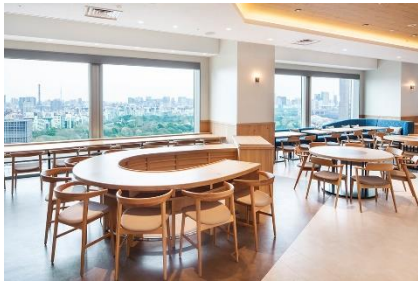
サザンタワーダイニング・バル

【お客様からのお問い合わせ先】TEL. 03-5354-2172 (ホテル予約 / 受付時間 9:00～17:30)