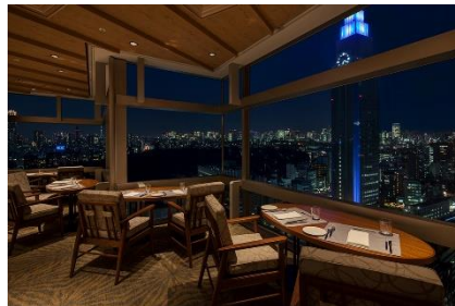
サザンタワーダイニング・レストラン